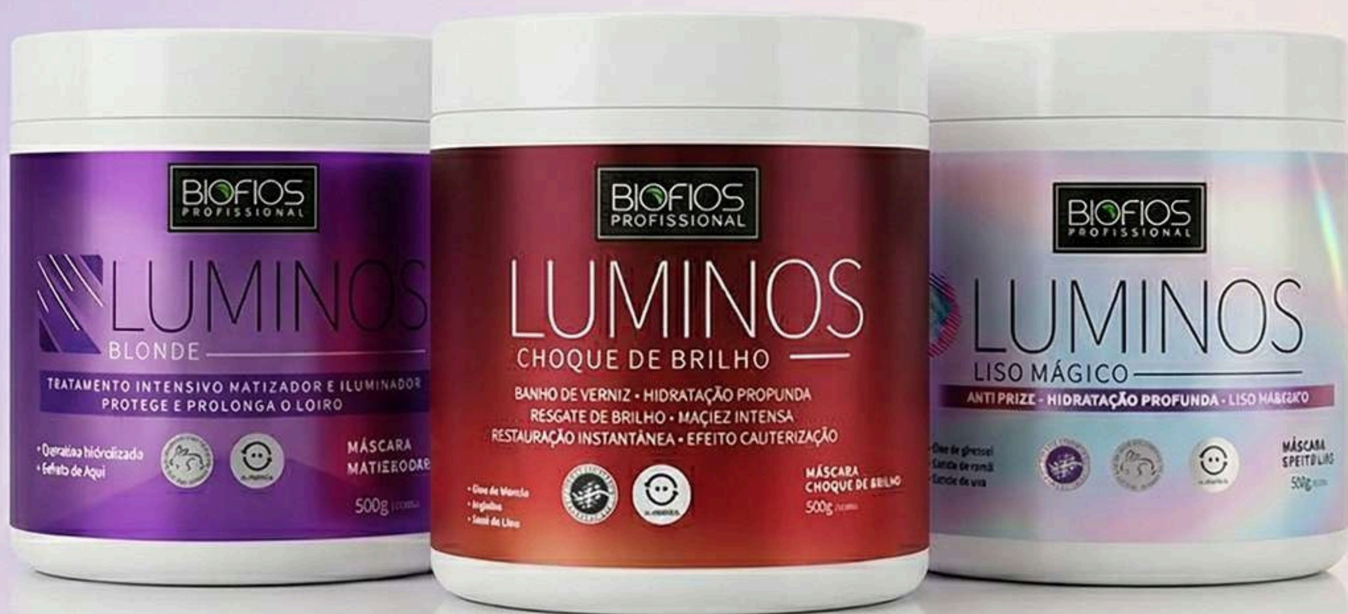
Luminos Liso Mágico 500g

As máscaras profissionais Luminos oferecem uma hidratação profunda, sendo ideais para uma variedade de tratamentos e processos de reparação capilar.