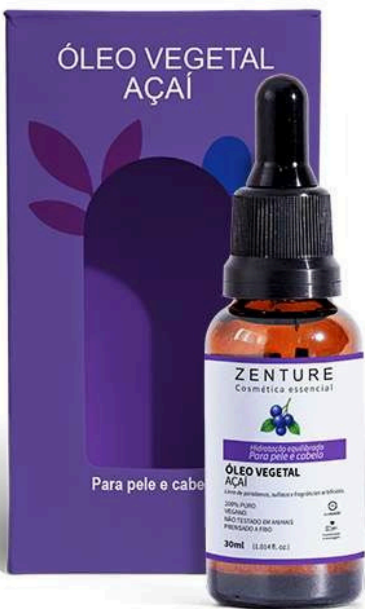
Óleo Vegetal Açaí 30ml