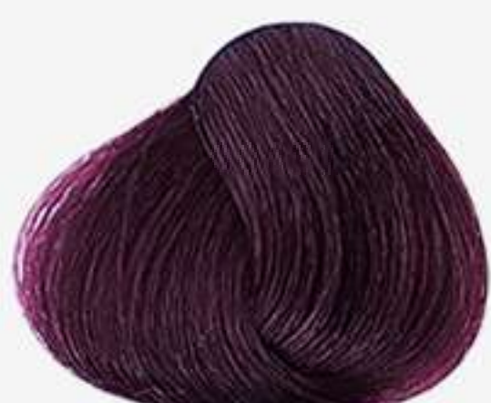
8.26 VERMELHO MARSALA