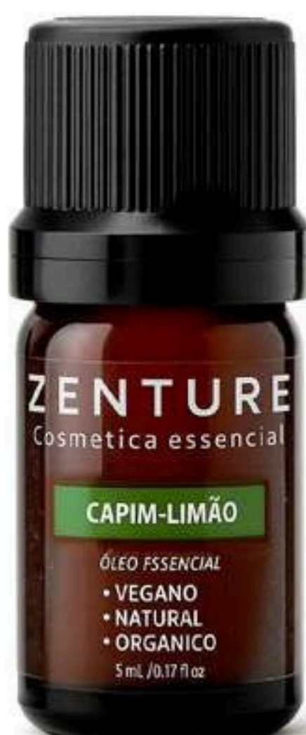
Óleo Essencial Capim Limão 5ml