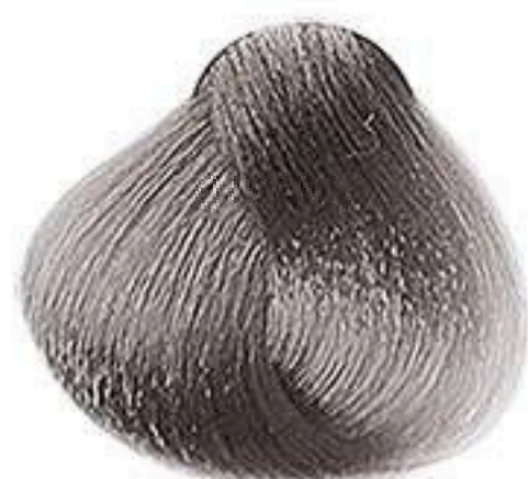
9.19 LOURO MUITO CLARO CINZA IRISADO