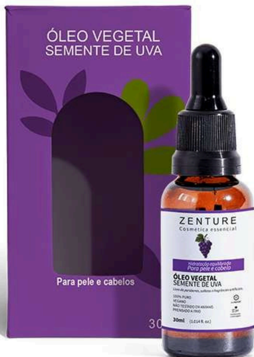
Óleo Vegetal Semente de Uva 30ml