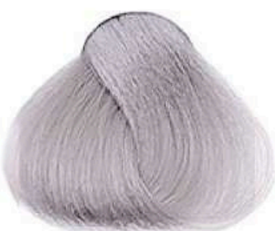
10.1 LOURO CLARISSÍMO CINZA