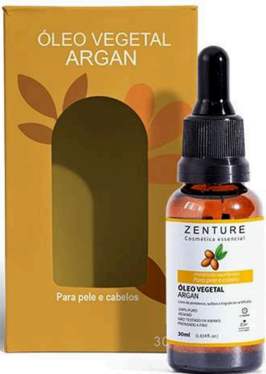
Óleo Vegetal Argan 30ml