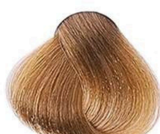
8.73 LOURO CLARO MARROM DOURADO