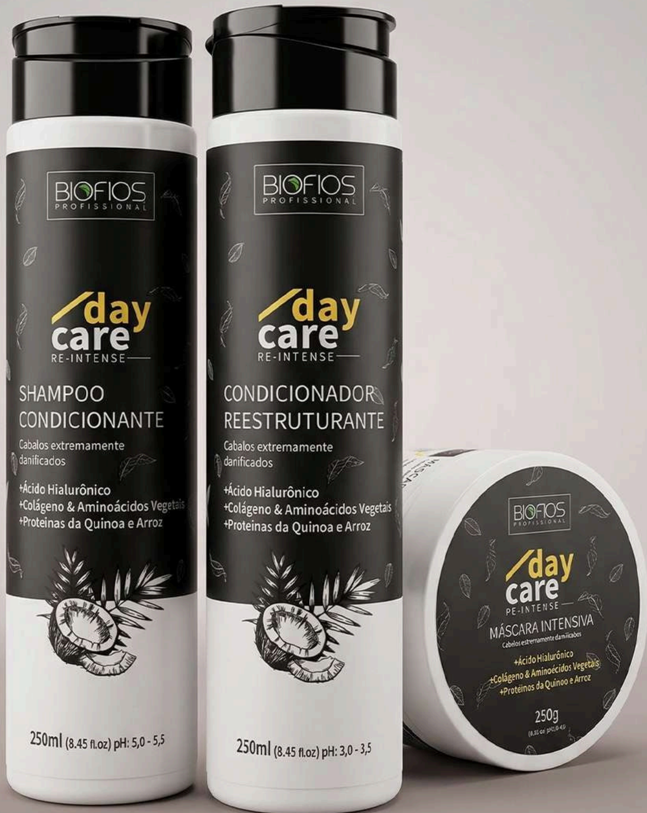
Máscara Intensiva 250g