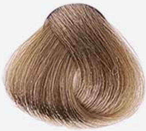
8.3 LOURO CLARO DOURADO