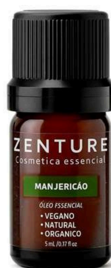
Óleo Essencial Manjeriçao 5ml