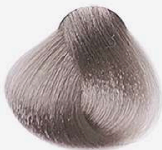
8.89 LOURO CLARO PÉROLA