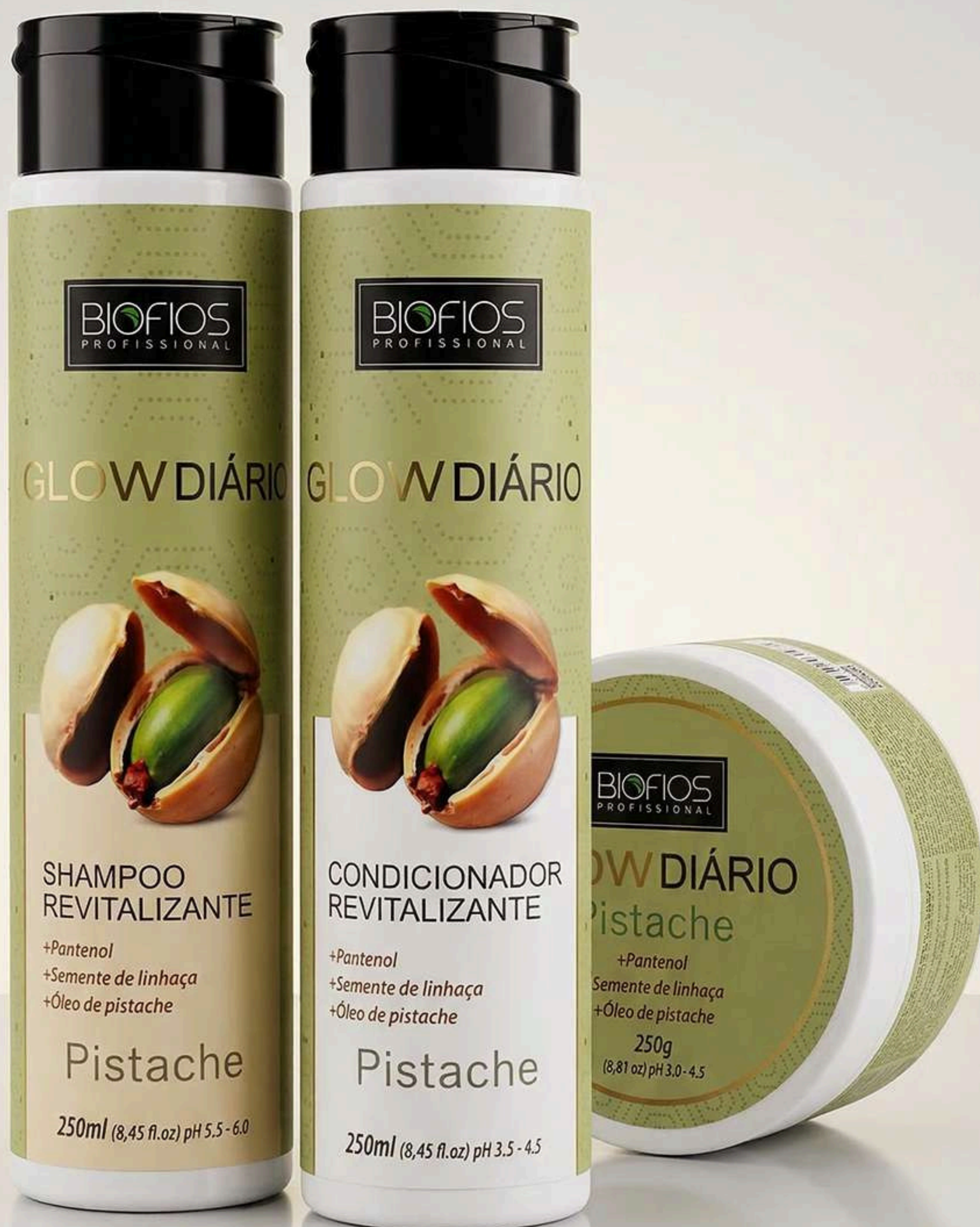
Shampoo Revitalizante 250ml