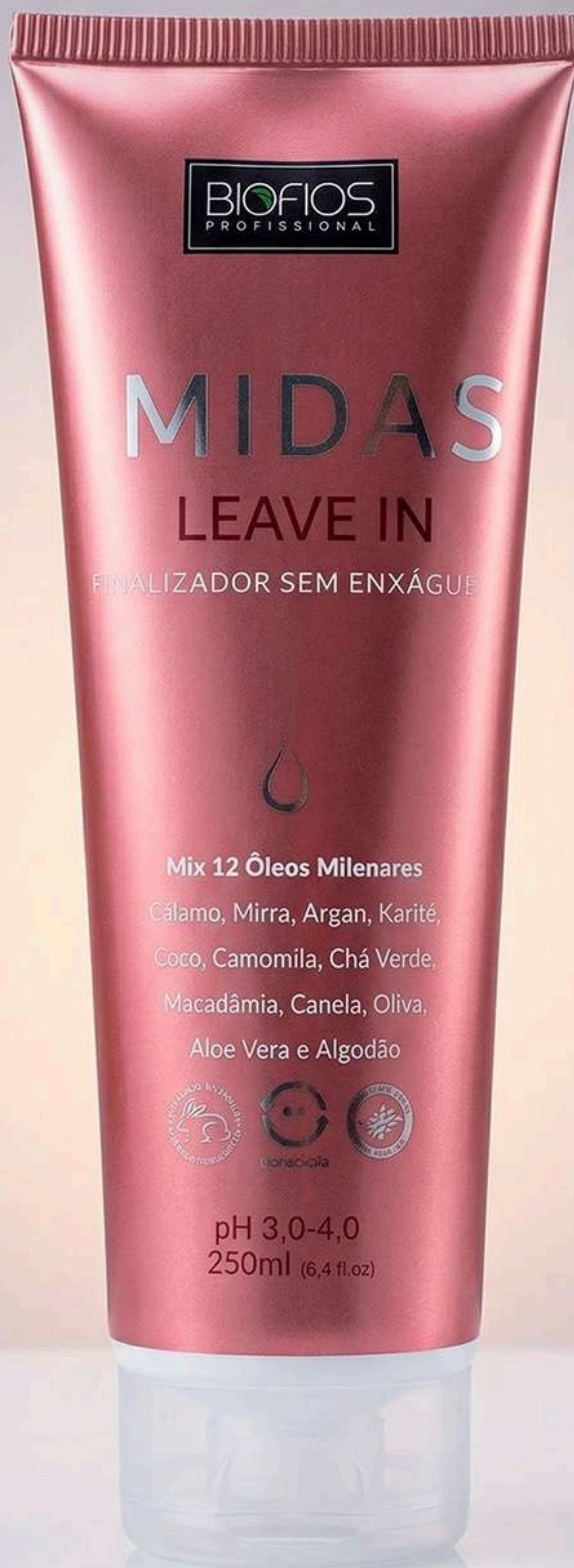
Midas Leave-In 250ml