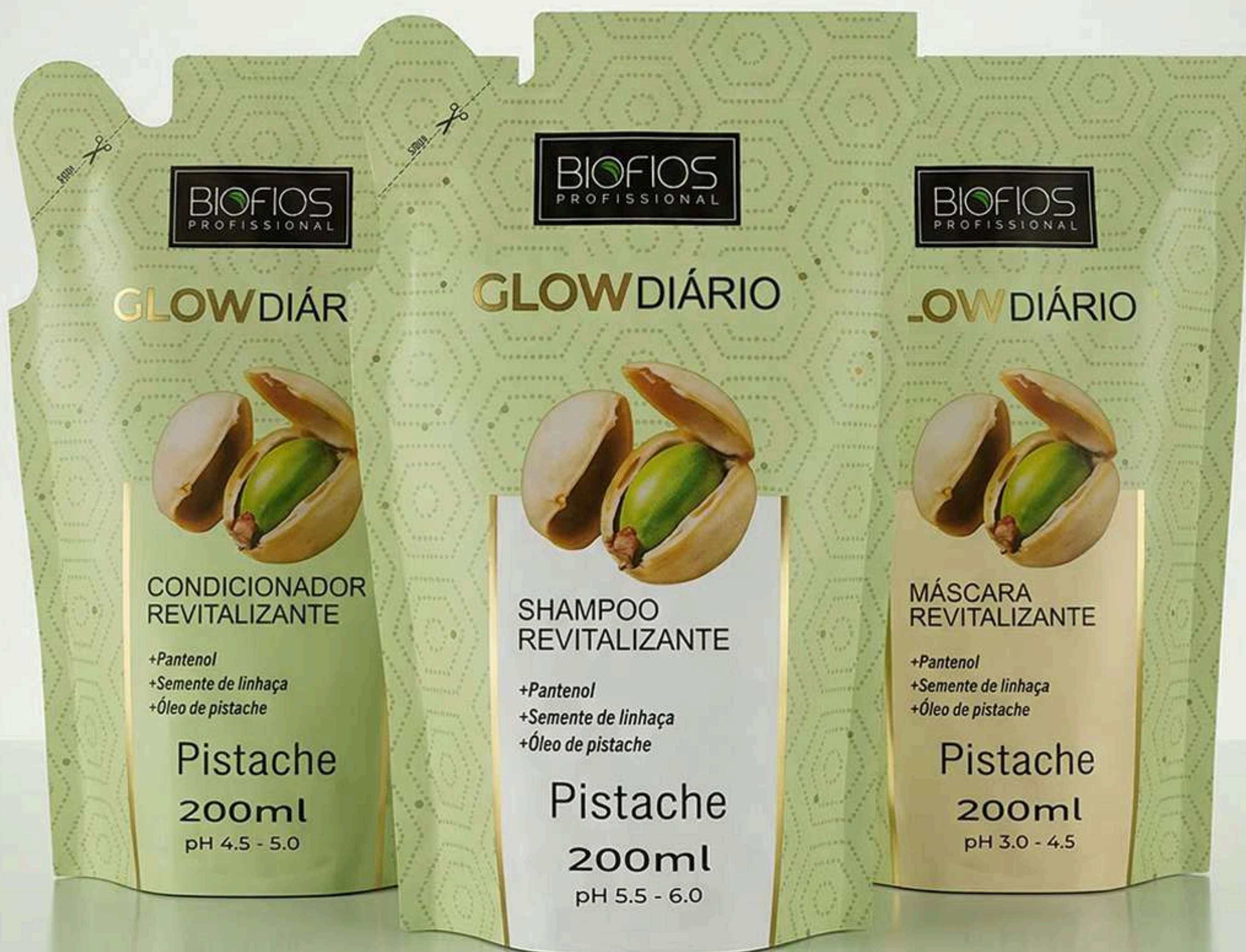
Glow Diário Shampoo Revitalizante Refil 200ml

revitaliza seus cabelos diariamente com o cuidado luxuoso dessa linha. Enriquecida com os nutrientes de Pistache, sua fórmula hidrata profundamente os cabelos, nutre os fios e combate o ressecamento.