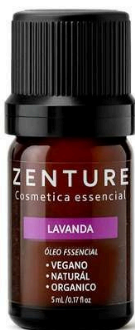
Óleo Essencial Lavanda 5ml