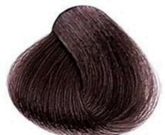
5.1 CASTANHO CLARO CINZA