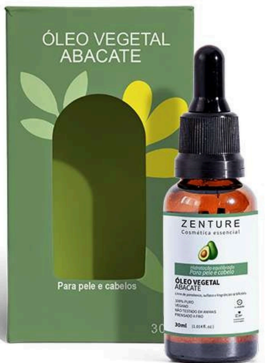
Óleo Vegetal Abacate 30ml