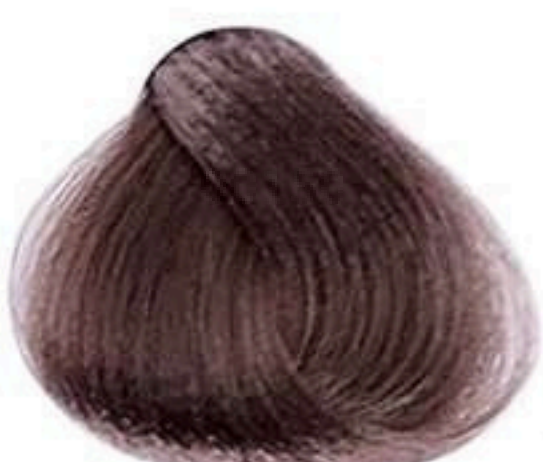
6.1 LOURO ESCURO CINZA