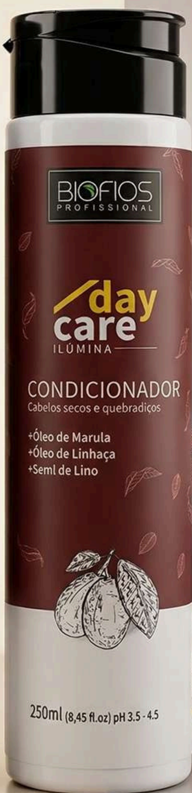
Condicionador Ilúmina 250ml