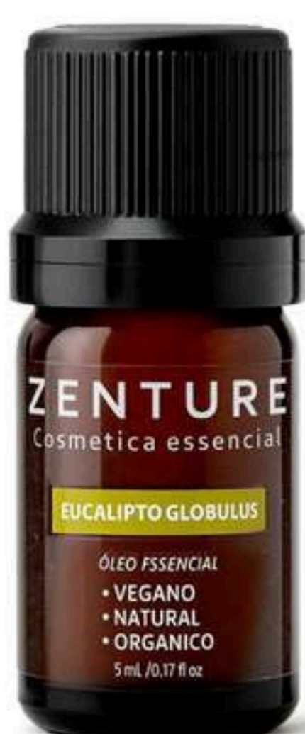
Óleo Essencial Eucalipto Globulus 5ml