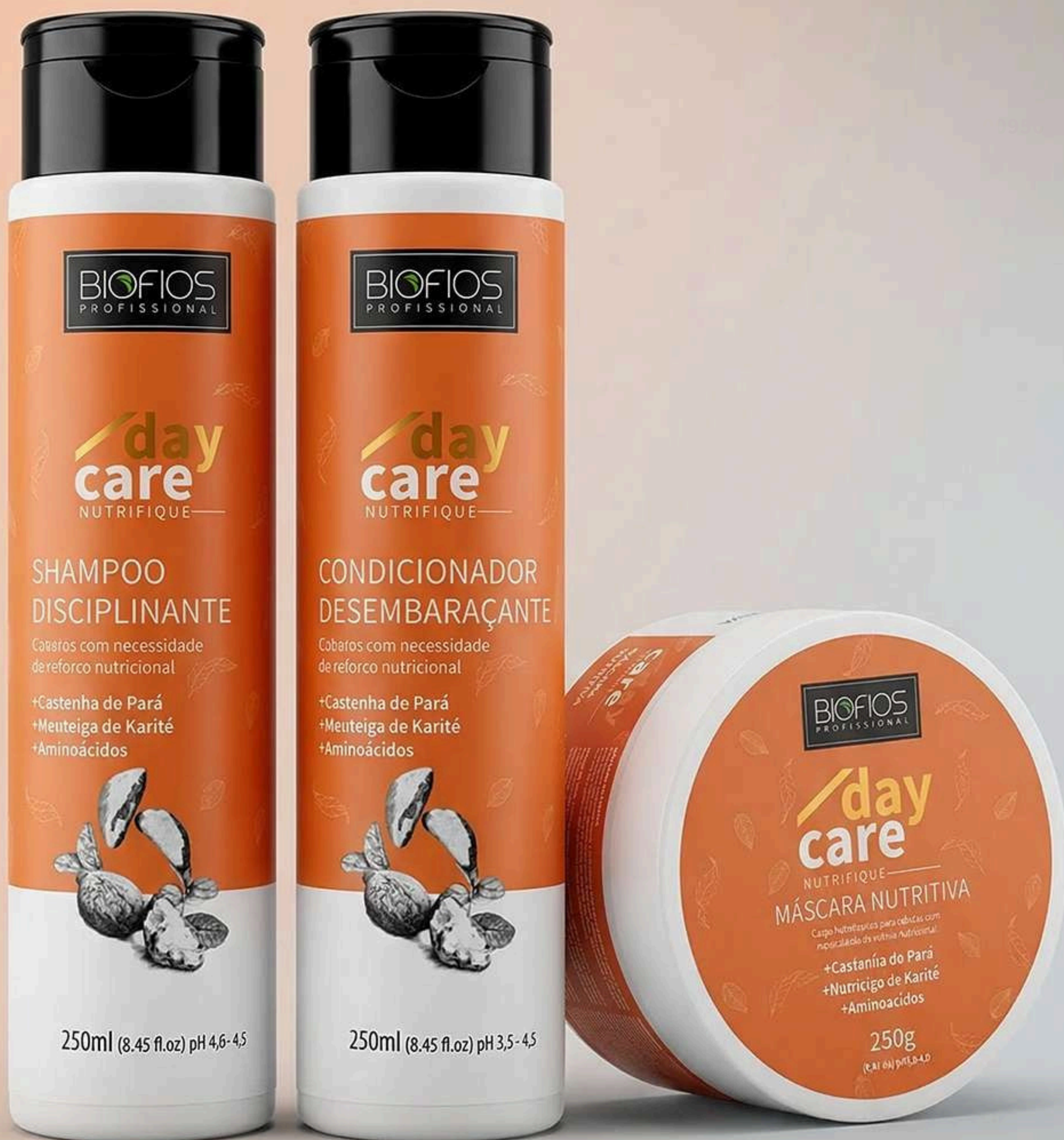
Shampoo Disciplinante 250ml