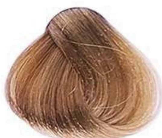
7.7 LOURO MÉDIO MARROM