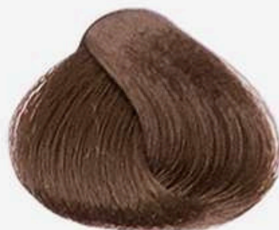
6.0 LOURO ESCURO