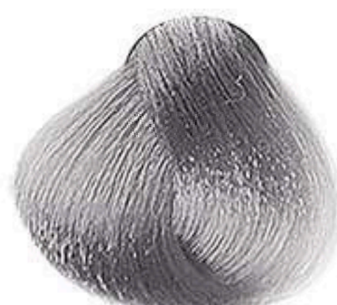
12.11 SUPERCLAREADOR CINZA INTENSO