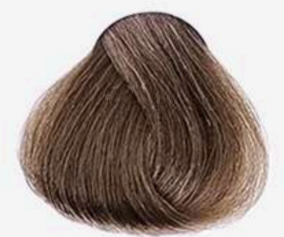
7.3 LOURO MÉDIO DOURADO