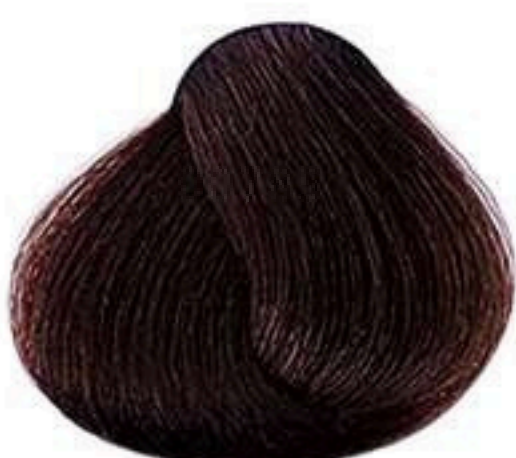
6.7 LOURO ESCURO MARROM