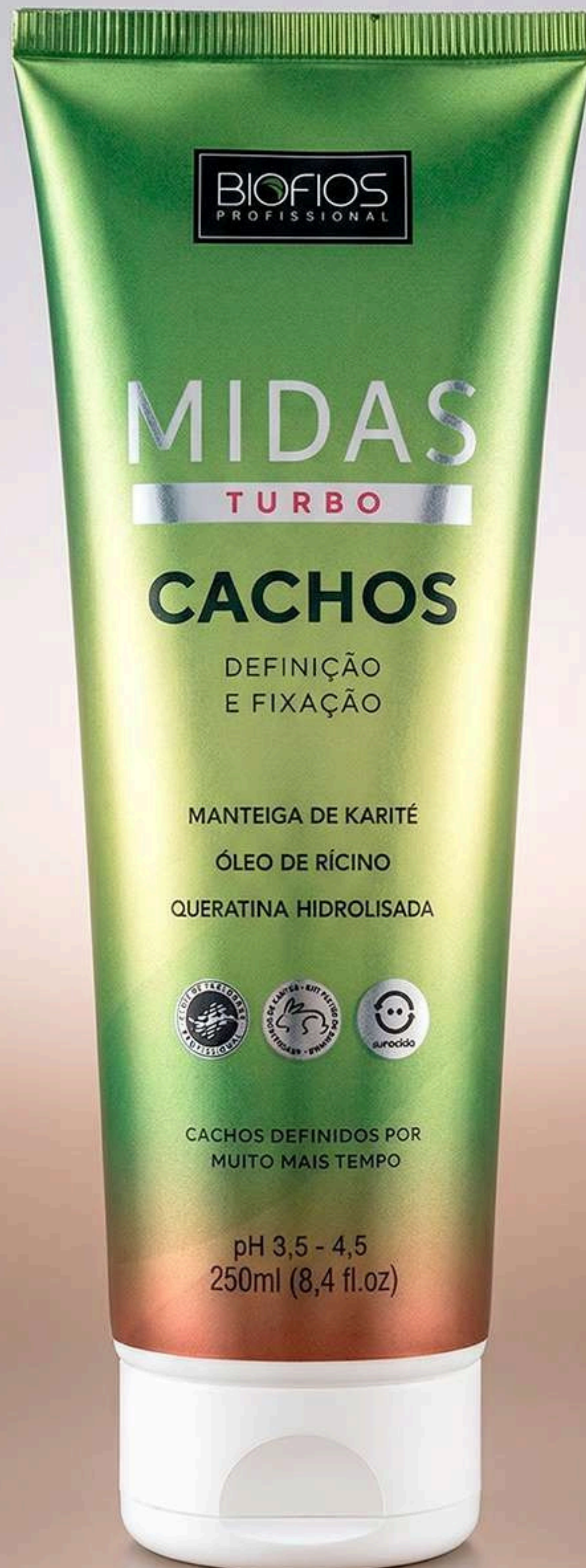
Midas Turbo Cachos 250ml