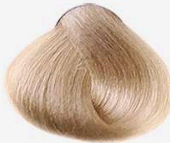
9.31 LOURO MUITO CLARO BEGE