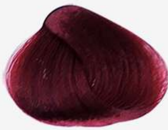
66.66 LOURO ESCURO VERMELHO INTENSO ESPECIAL