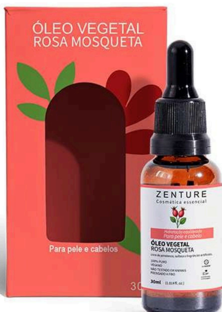
Óleo Vegetal Semente de Uva 30ml