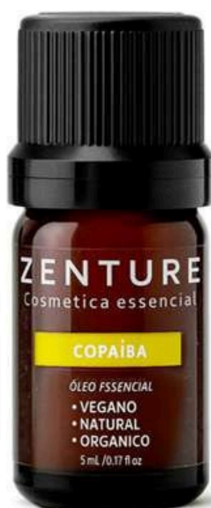
Óleo Essencial Copaíba 5ml