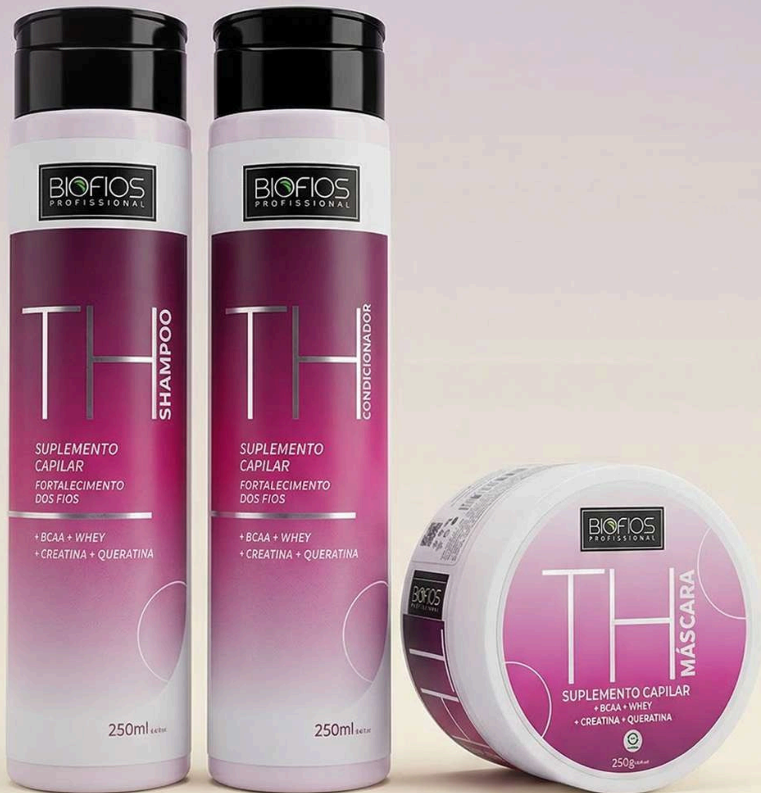
Shampoo TH 250ml