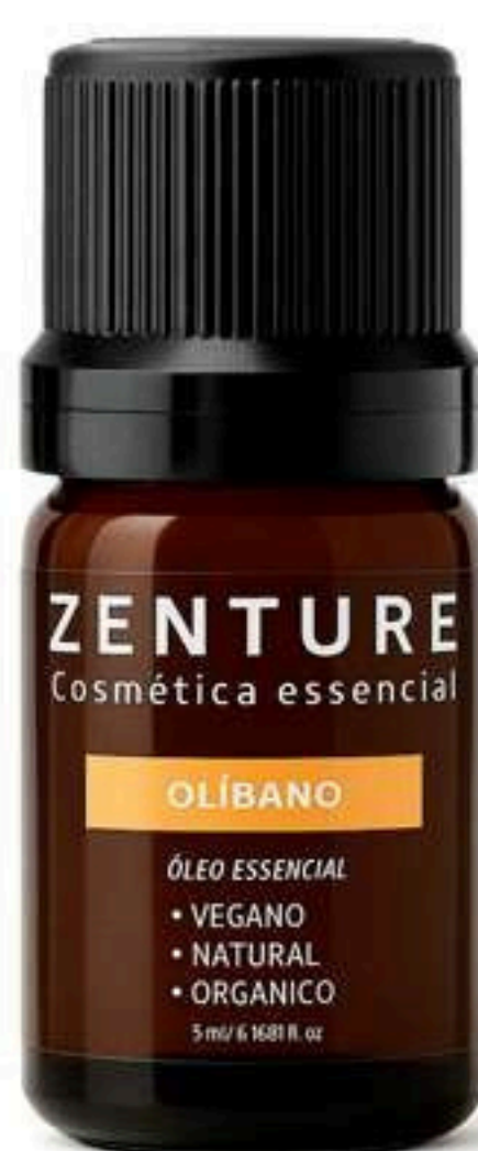
Óleo Essencial Olíbano 5ml