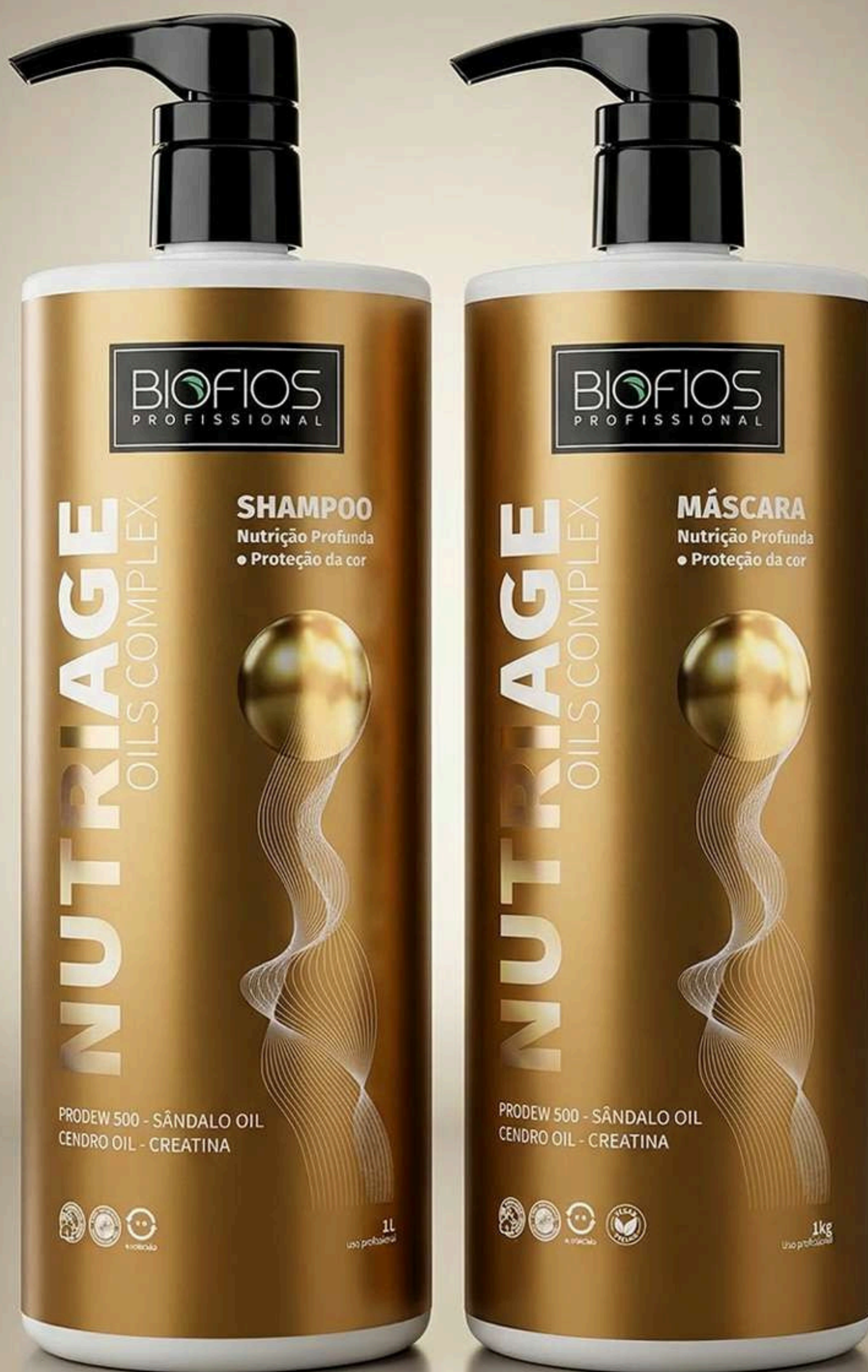
Shampoo Nutritivo 1L

Tratamento nutritivo de alto desempenho que hidrata profundamente, repara danos, restaura a suavidade, aumenta a maleabilidade, corrige o ressecamento, deixando os fios sedosos e com brilho intenso.