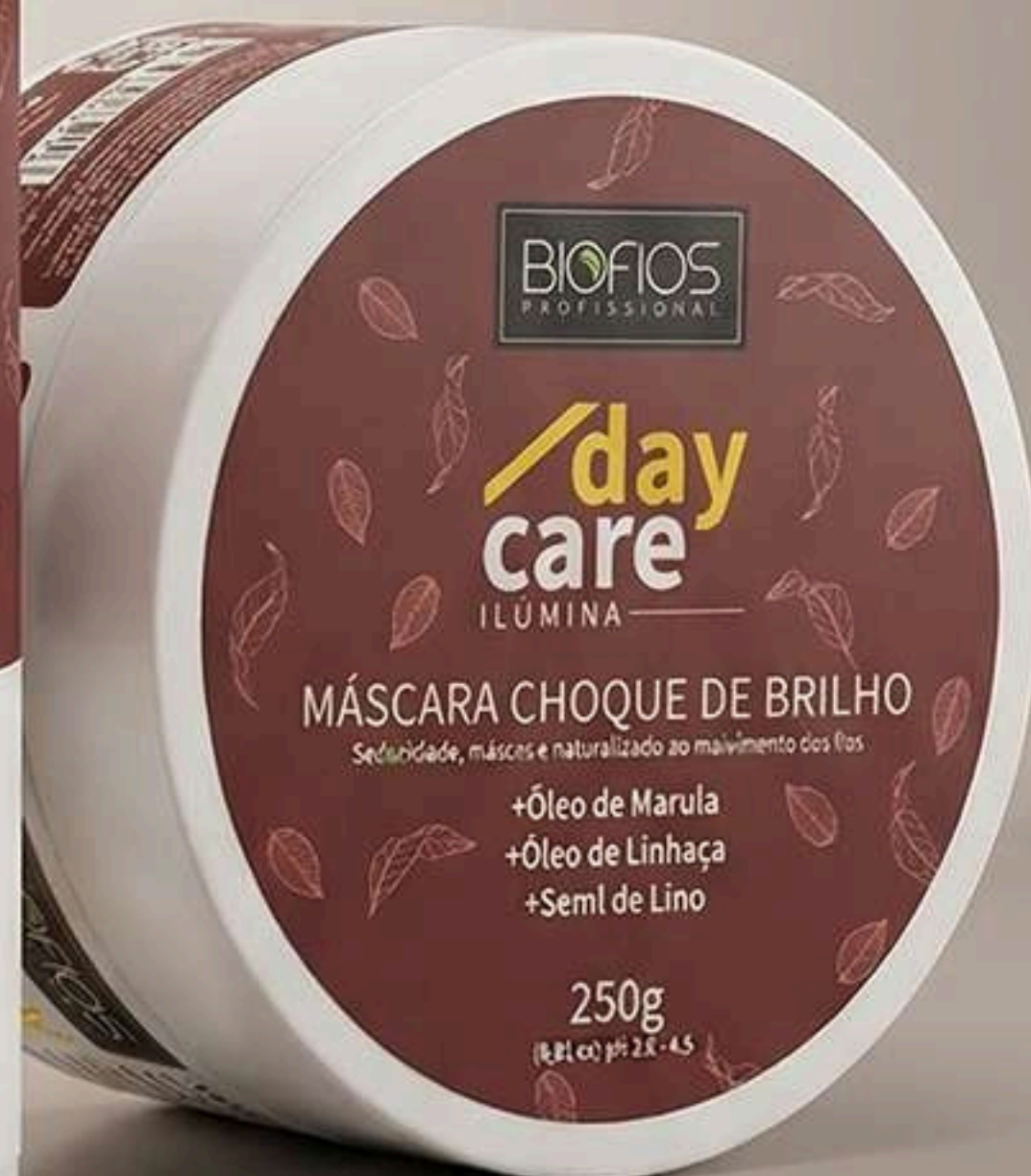
Máscara Choque de Brilho Ilúmina 250g