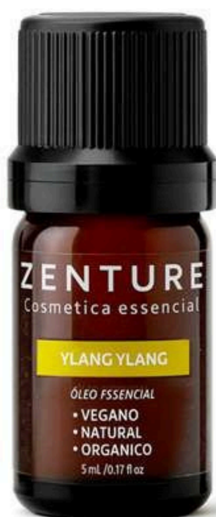
Óleo Essencial Ylang Ylang 5ml