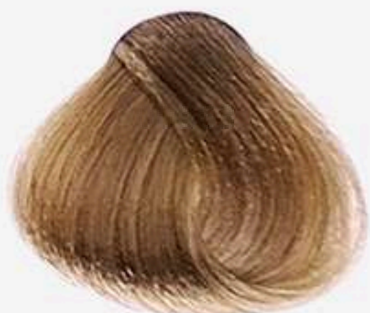
8.31 LOURO CLARO BEGE