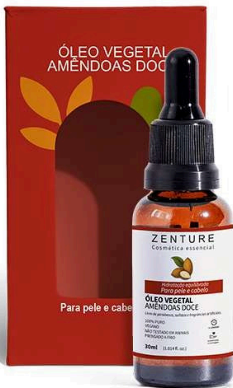
Óleo Vegetal Amendoa Doce 30ml