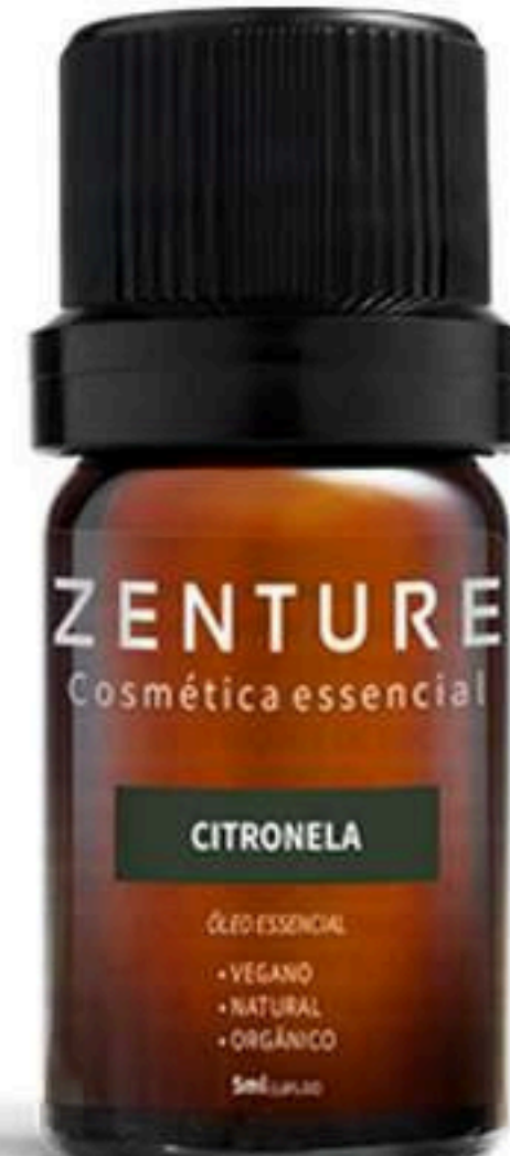
Óleo Essencial Citronela 5ml