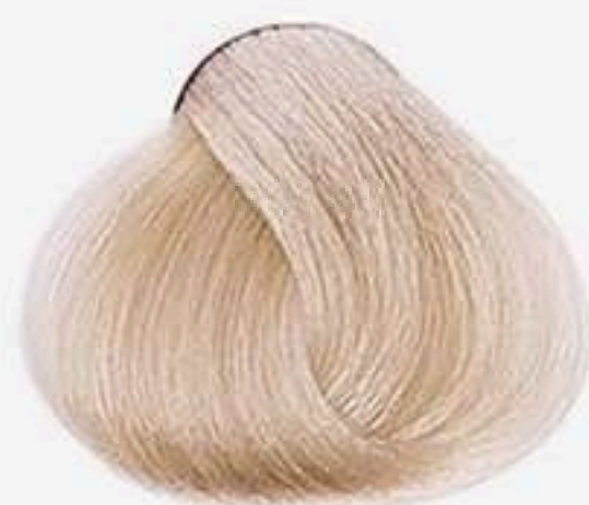
9.0 LOURO MUITO CLARO