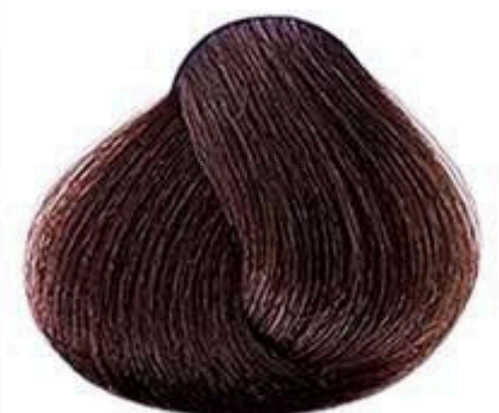
5.7 CASTANHO CLARO MARROM