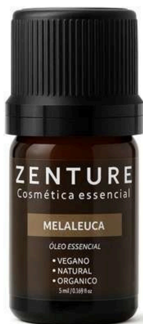
Óleo Essencial Melaleuca 5ml