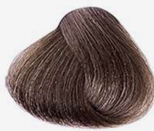
6.3 LOURO ESCURO DOURADO