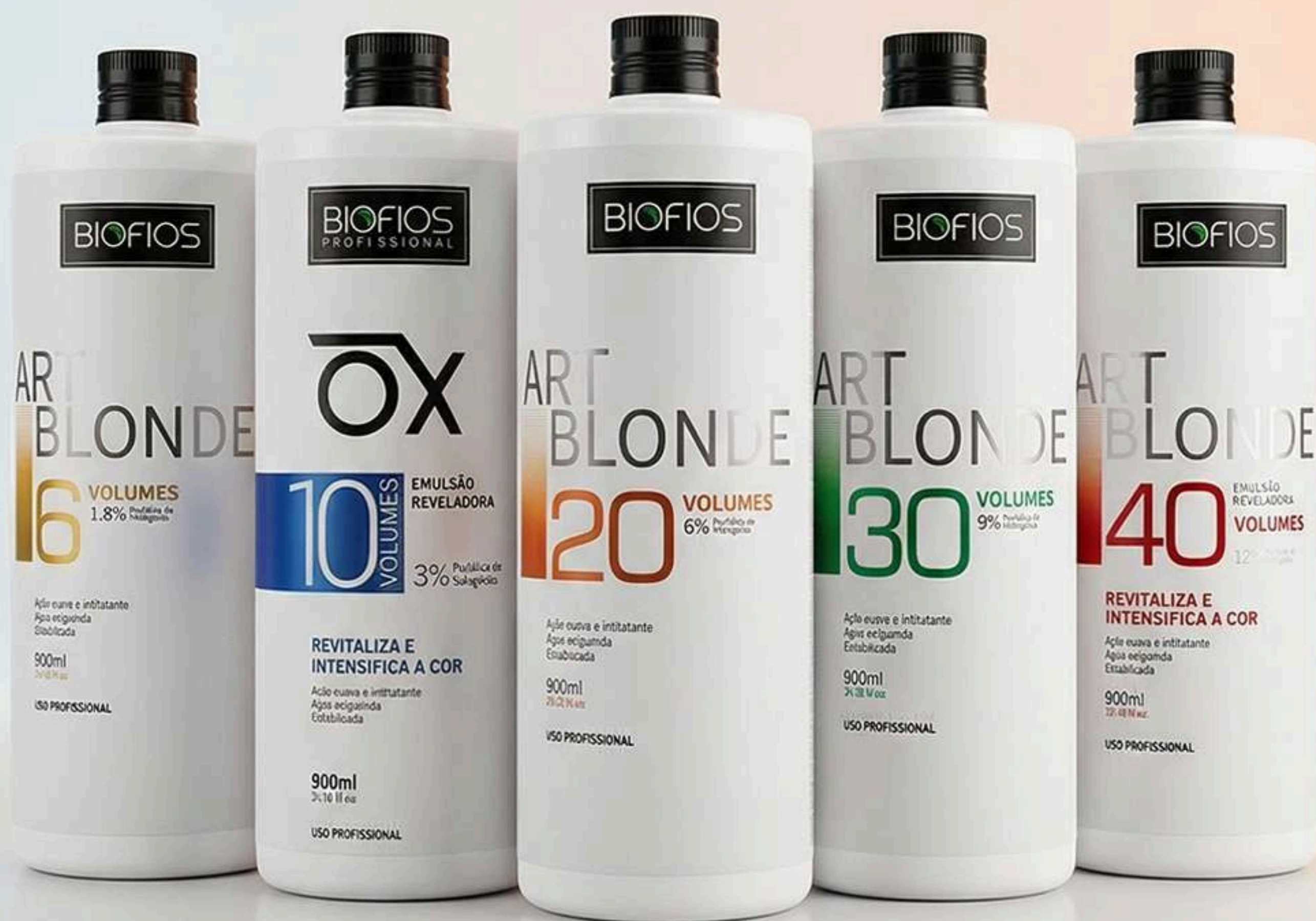
OX 6 Vol 900ml

Emulsões Reveladoras possuem altas coberturas de brancos e baixíssimos teores de amônia, combatendo o ressecamento, preservando a beleza e saúde dos fios.