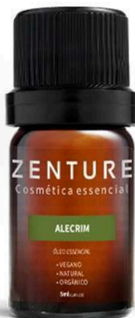
Óleo Essencial Alecrim 5ml