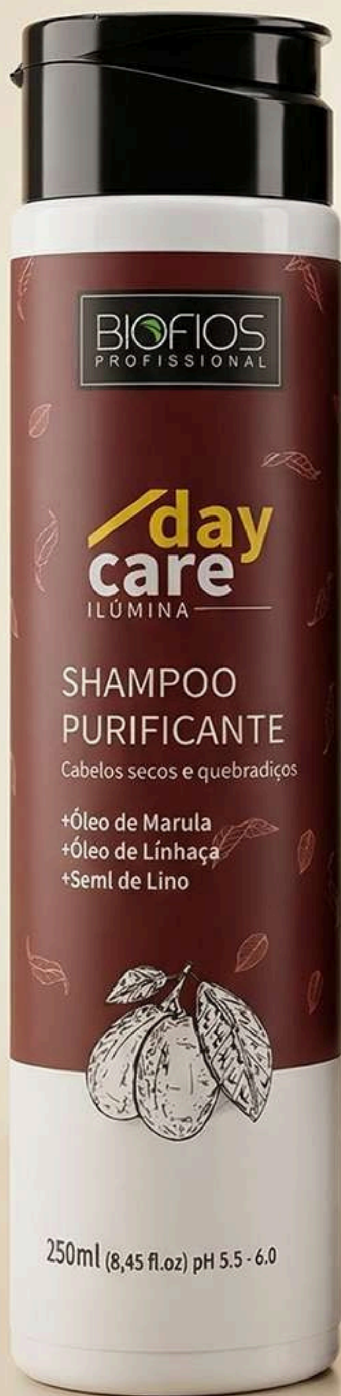
Shampoo Purificante Ilúmina 250ml