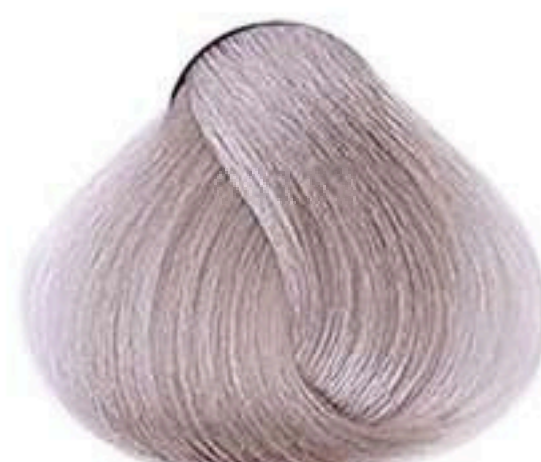
8.1 LOURO CLARO CINZA