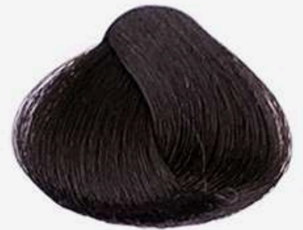
3.0 CASTANHO ESCURO