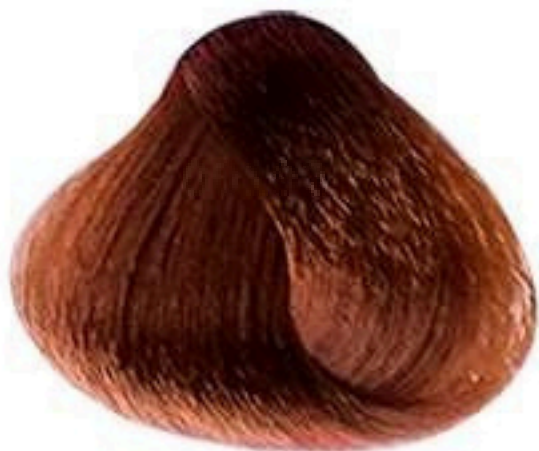
7.44 LOURO MÉDIO COBRE INTENSO