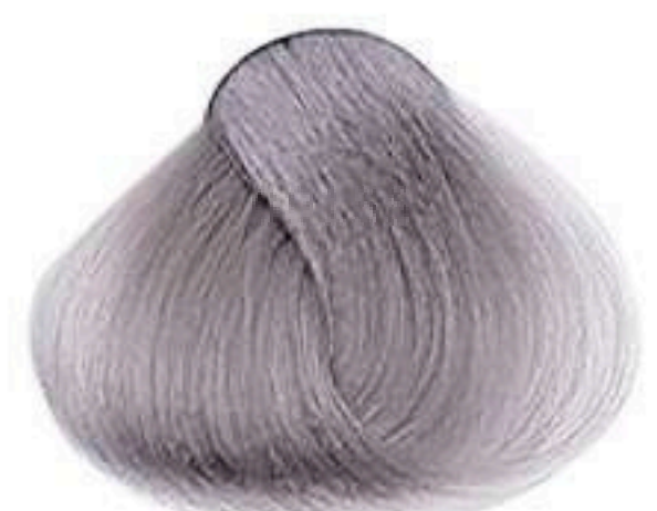
9.1 LOURO MUITO CLARO CINZA