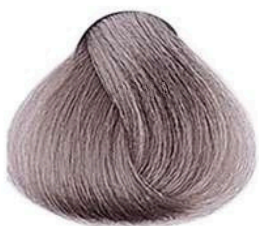
7.1 LOURO MÉDIO CINZA