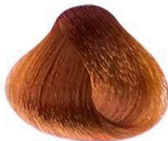
8.4 LOURO CLARO COBRE