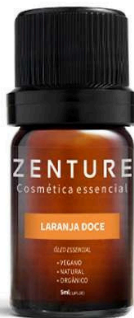
Óleo Essencial Laranja Doce 5ml