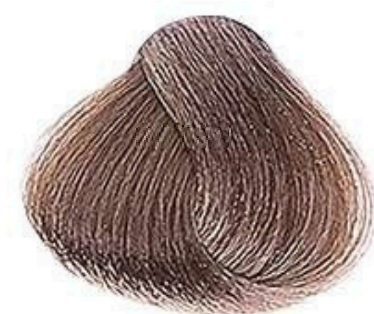
8.7 LOURO CLARO MARROM