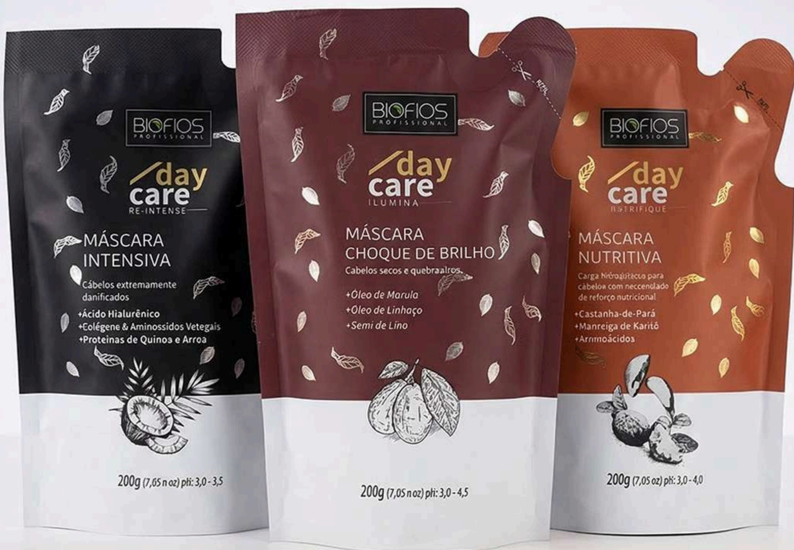
Day Care Máscara Ilúmina Refil 200g