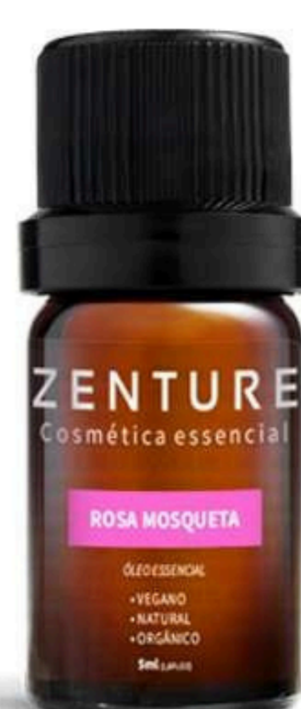
Óleo Essencial Rosa Mosqueta 5ml