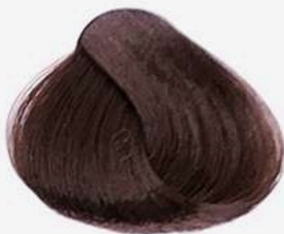
5.0 CASTANHO CLARO