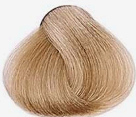
8.0 LOURO CLARO