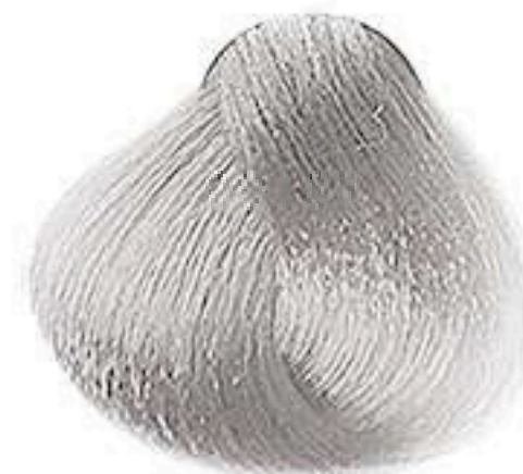
12.89 SUPERCLAREADOR PÉROLA