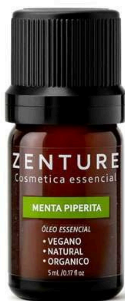
Óleo Essencial Menta Piperita 5ml