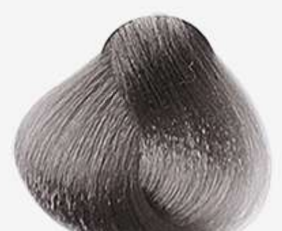
7.89 LOURO MÉDIO PÉROLA