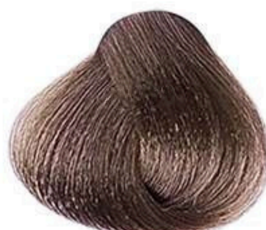
7.71 LOURO MÉDIO MARROM ACINZENTADO