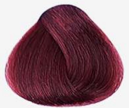
55.62 CASTANHO CLARO VERMELHO IRISADO ESPECIAL