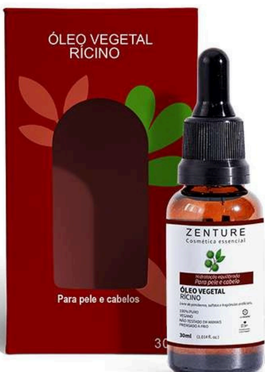
Óleo Vegetal Rícino 30ml