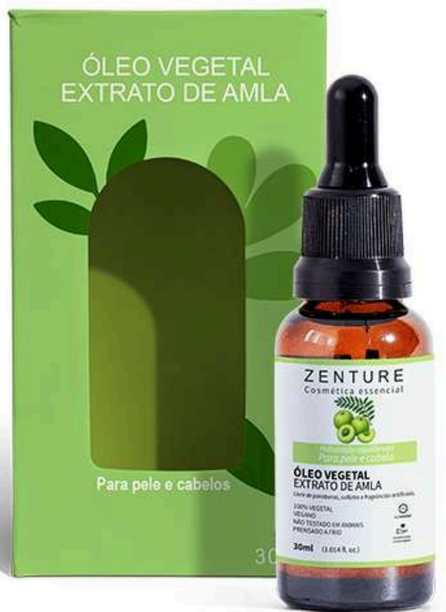
Óleo Vegetal Amla 30ml