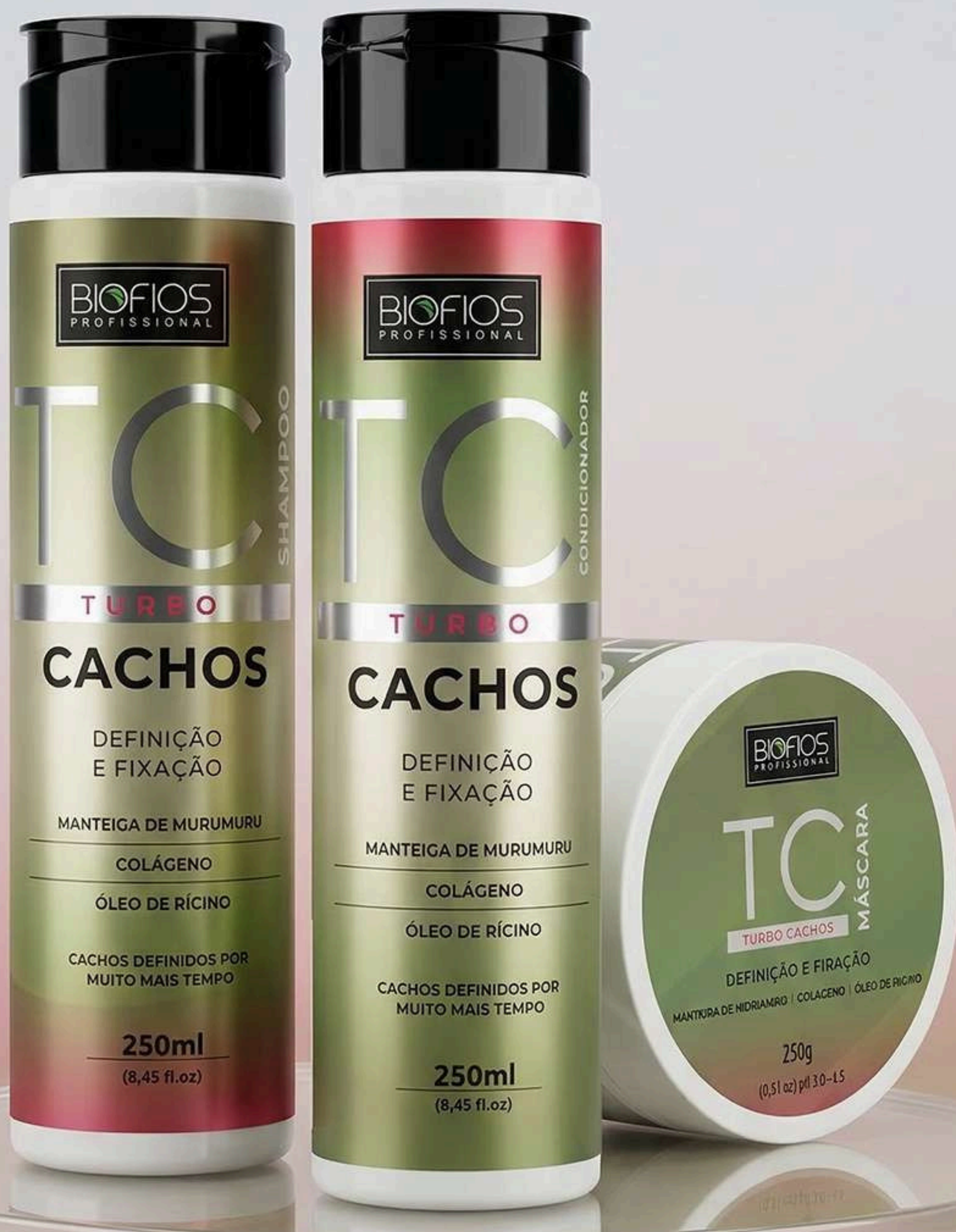
Shampoo Turbo Cachos 250ml