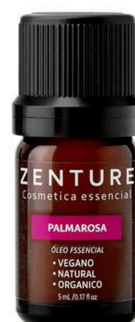
Óleo Essencial Palmarosa 5ml