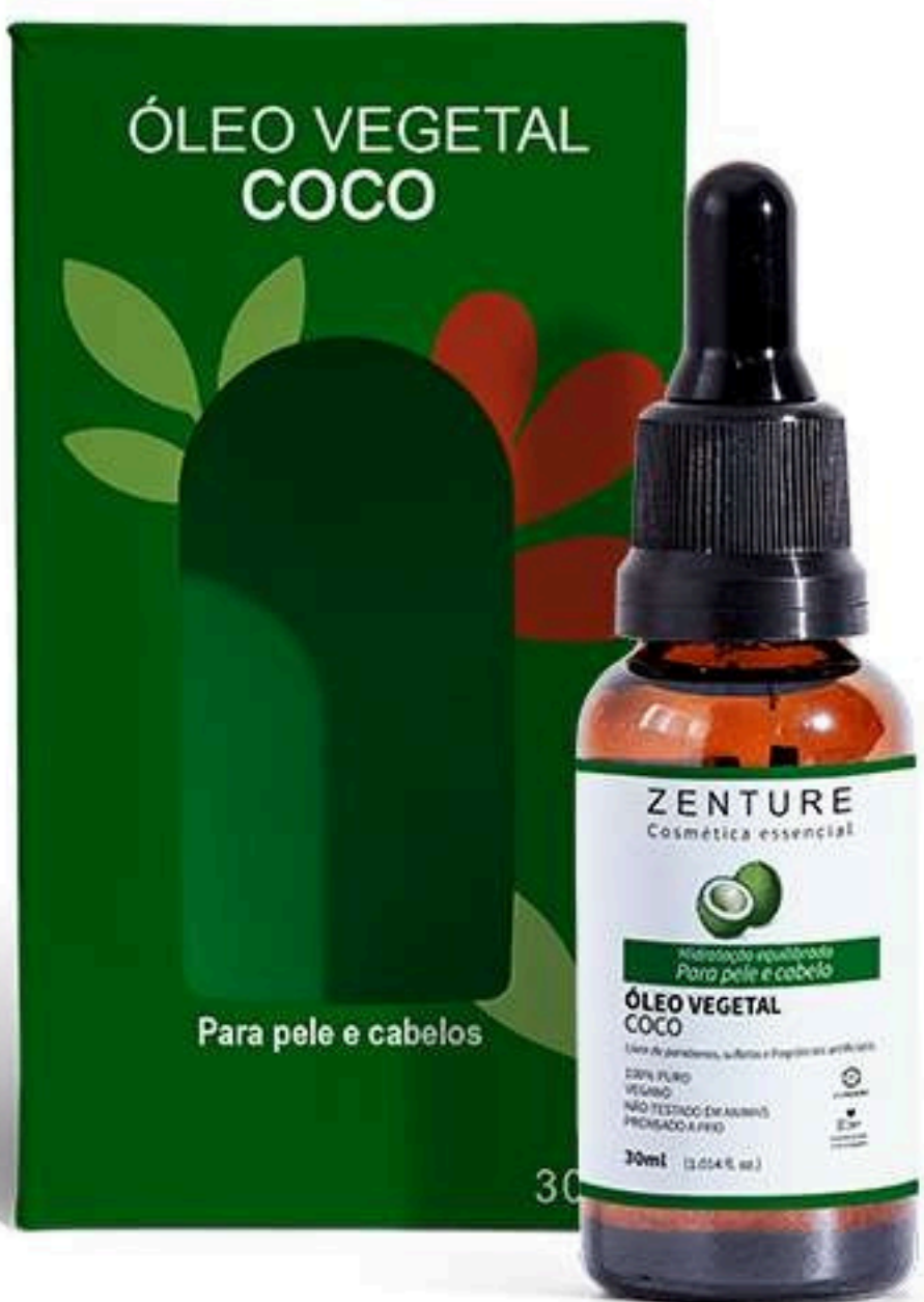
Óleo Vegetal Coco 30ml