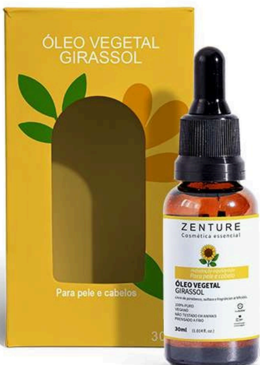
Óleo Vegetal Girassol 30ml