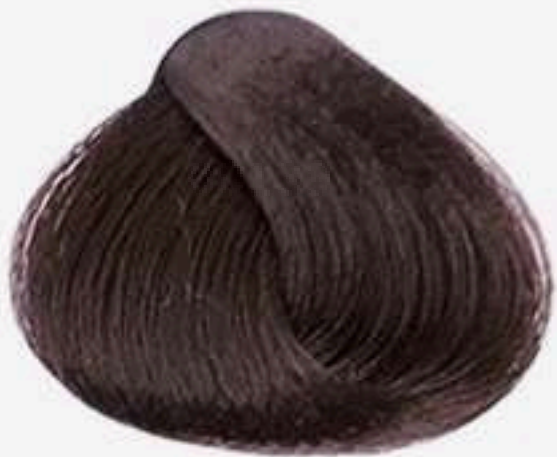
4.0 CASTANHO MÉDIO