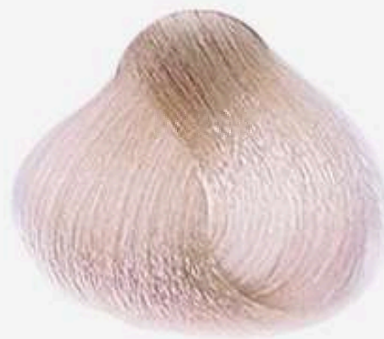
10.89 LOURO CLARÍSSIMO PÉROLA