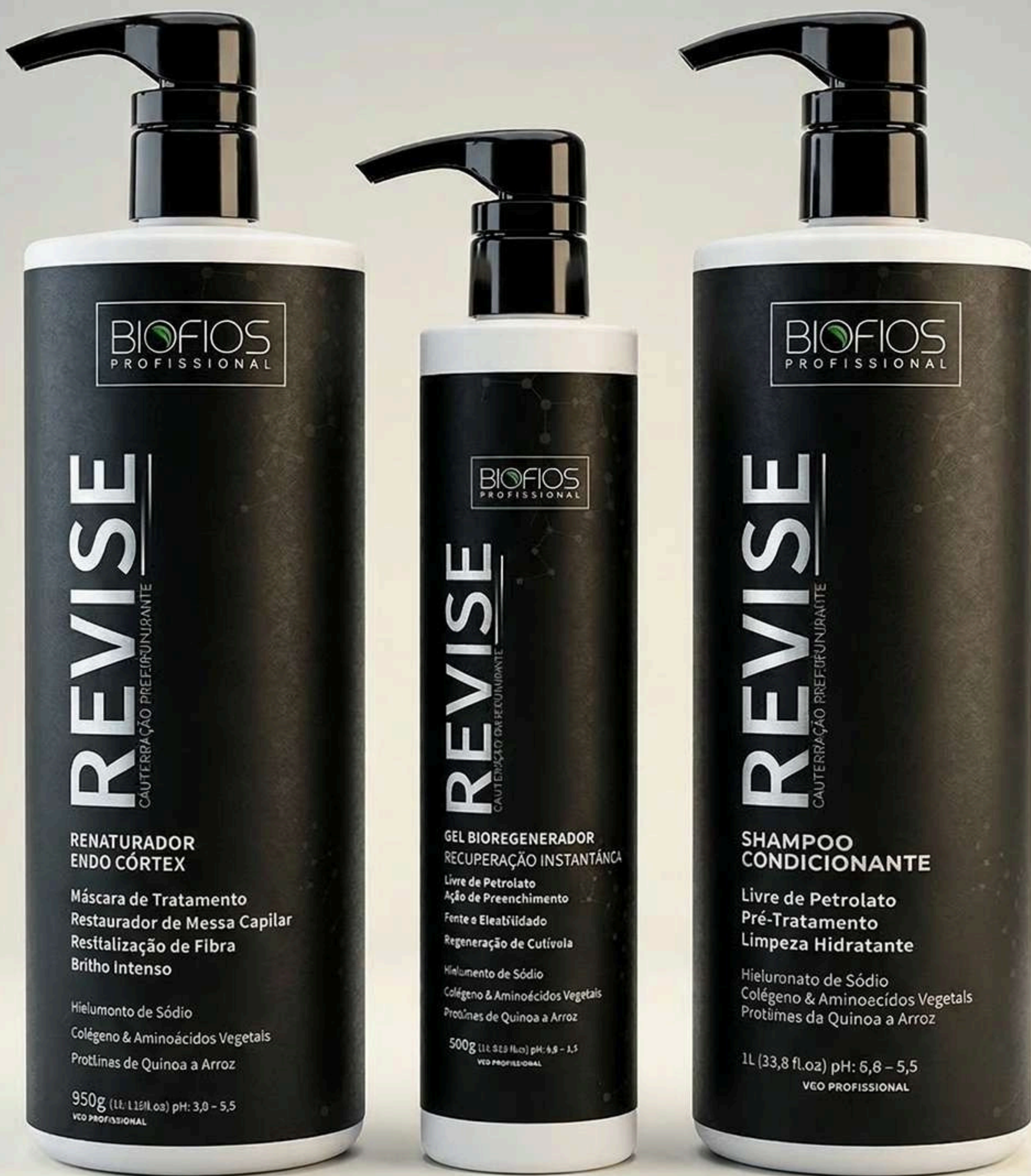
Máscara Endo CórTEX 950g

Ideal para os cabelos reprovados em teste de mechas, extremamente danificados, quimicamente tratados, porosos e emborrachados.