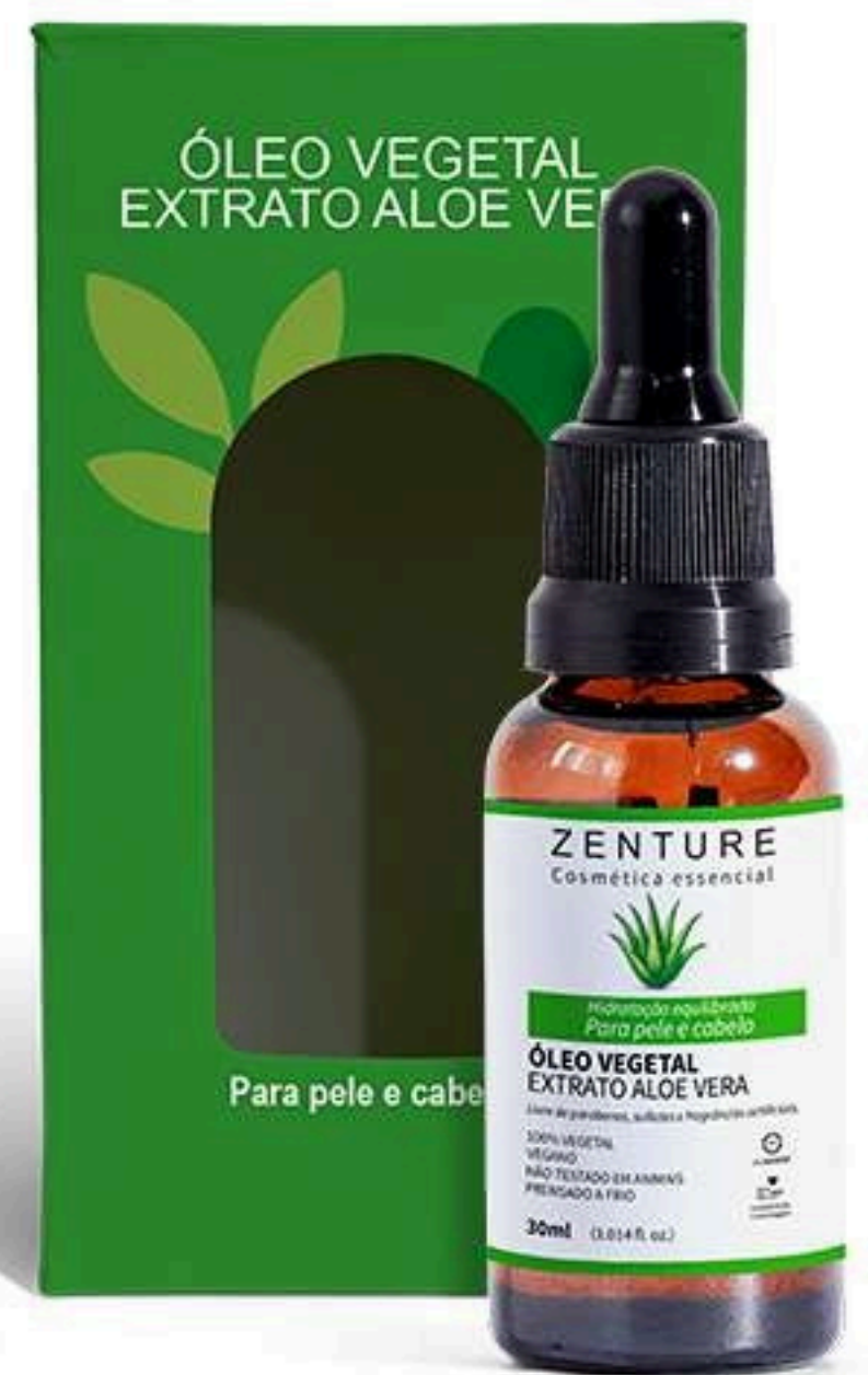
Óleo Vegetal Aloe Vera 30ml