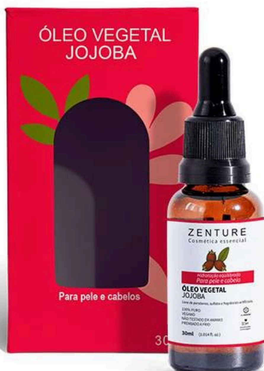
Óleo Vegetal Jojoba 30ml