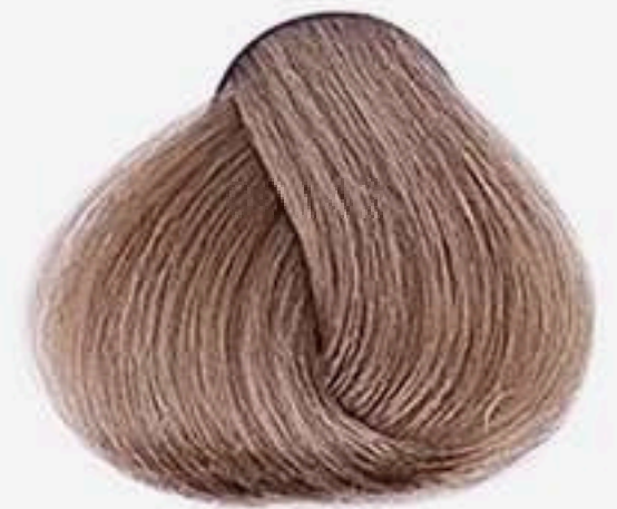
7.0 LOURO MÉDIO