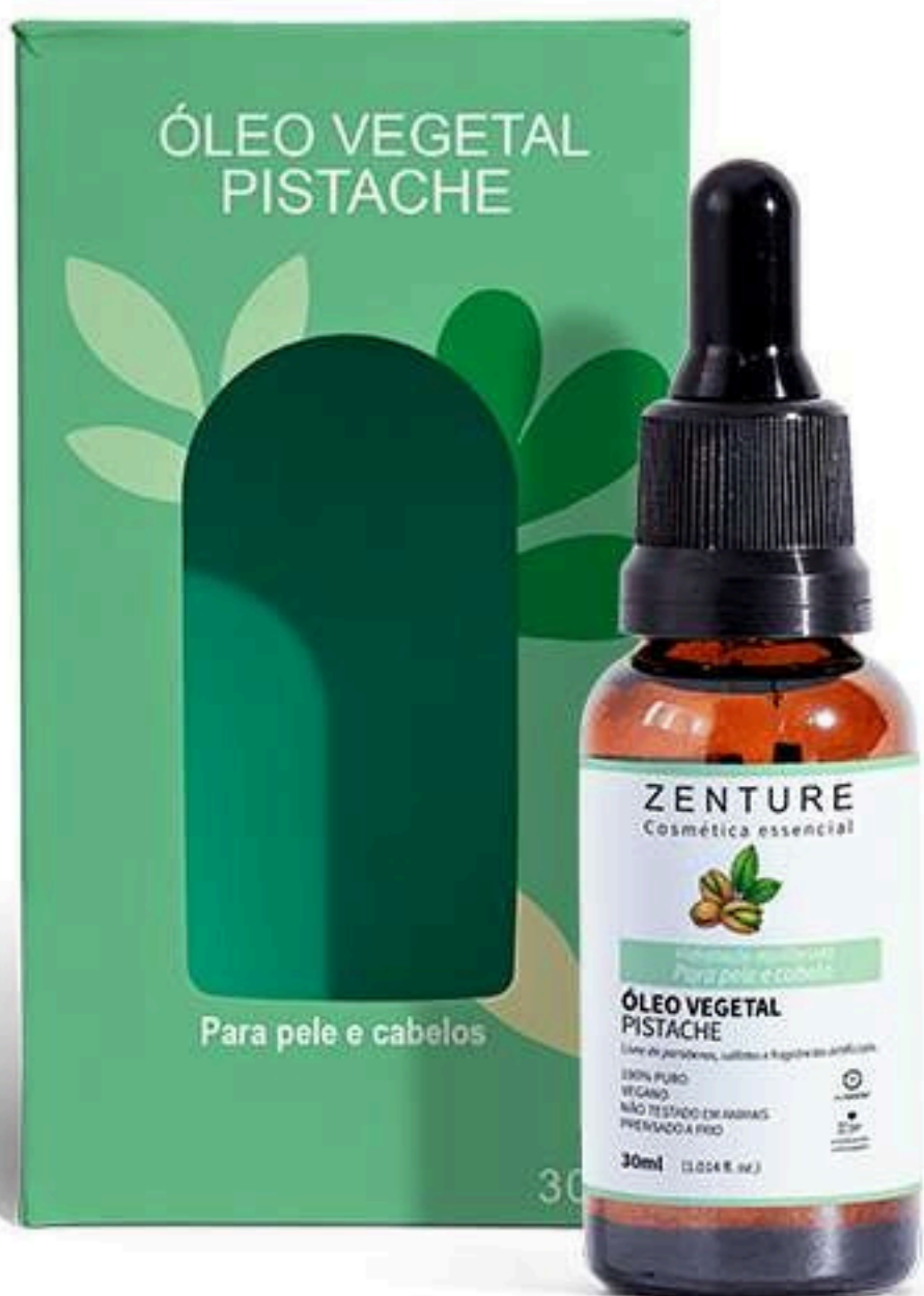
Óleo Vegetal Pistache 30ml