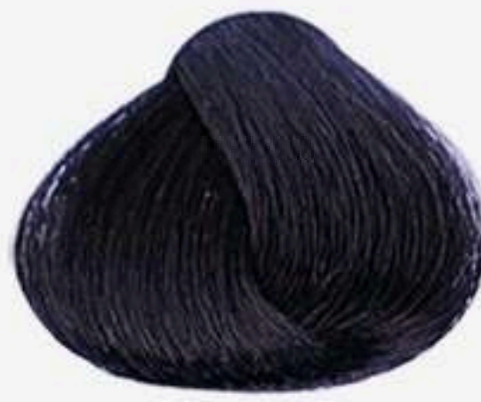
2.8 PRETO AZULADO