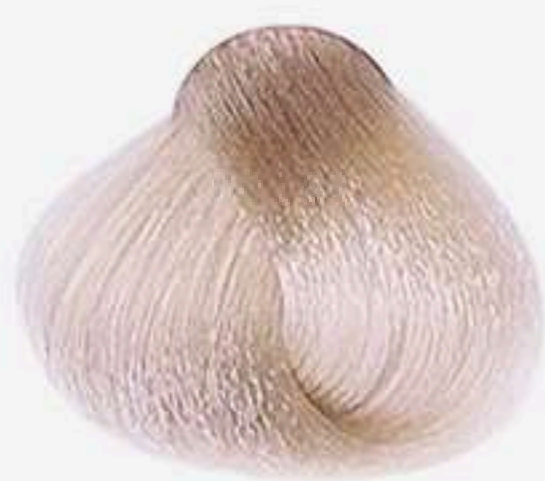
9.89 LOURO MUITO CLARO PÉROLA