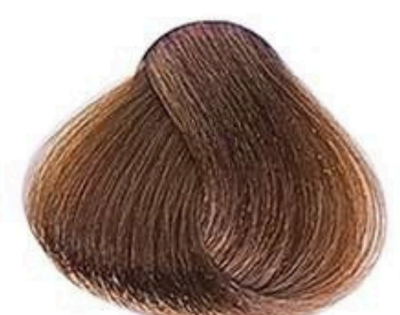
7.73 LOURO MÉDIO MARROM DOURADO